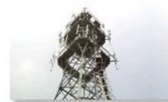
Mobile plant maintenance