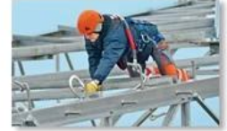
Work at height