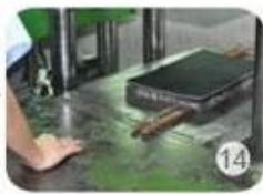
Inner padding production