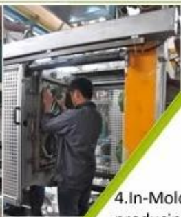
4. In-Mold producing process