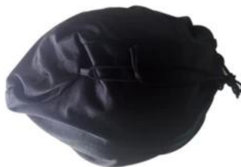
Soft cloth bag