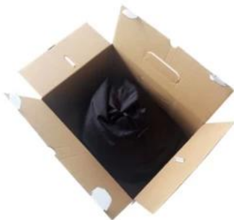
Cloth bag + Box Packaging White Box size: 31*23*18cm