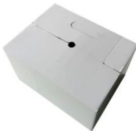
9 boxes/carton Master carton: 68*32*54cm