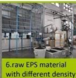
6. raw EPS material with different density