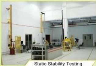
Static Stability Testing

Every manufacturing steps at AURORA follows adhere to strict quality parameters and focus on quality throughout the each stagesinvolved. All raw material and semi finished goods at AURORA pass strict quality control. The finished product, helmets at Aurora is then tested and qualified to export to the world.