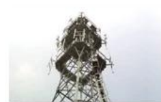
Mobile plant maintenance