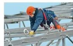
Work at height