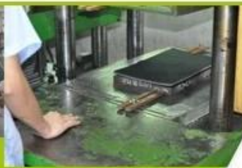
7. Inner padding Production