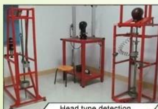
Head type detection