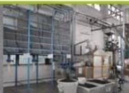
6. raw EPS material with different density