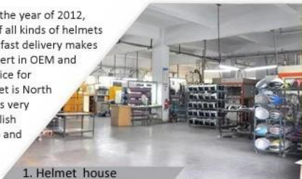
1. Helmet house

Shenzhen Aurora Sports Goods Co., LTD established in the year of 2012, more than 22 years experience. Expert in production of all kinds of helmets for different sports. Excellent quality, reasonable price, fast delivery makes us get very good reputation among our customers. Expert in OEM and ODM orders. Our skilled R&D team offers one stop service for throughout customers. 99% export and our main market is North America, European, Australia, Japan etc. Your enquiry is very welcomed and we will try our utmost to help you establish solid market. We are looking for long term relationship and get win win situation.