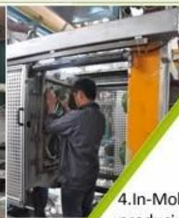
4. In-Mold producing process