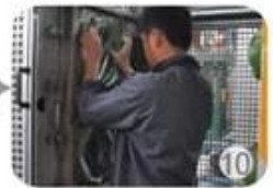
In-mold producing process