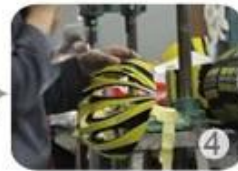
Trimming dug hole