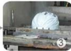
PC blister manufacture