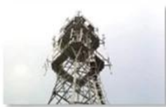
Mobile plant maintenance