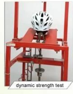
dynamic strength test