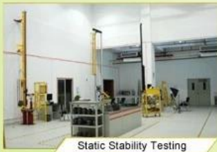
Static Stability Testing

Every manufacturing steps at AURORA follows adhere to strict quality parameters and focus on quality throughout the each stagesinvolved. All raw material and semi finished goods at AURORA pass strict quality control. The finished product, helmets at Aurora is then tested and qualified to export to the world.