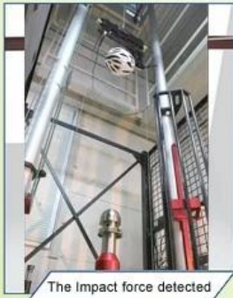
The Impact force detected