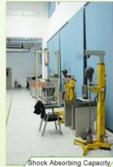
Shock Absorbing Capacity