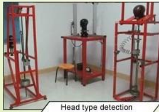
Head type detection