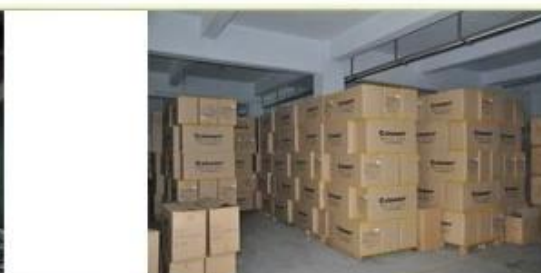
9. finished helmet