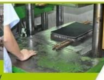
7. Inner padding Production