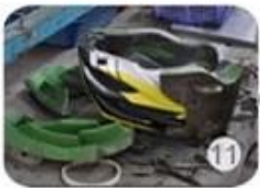
semi-finished In-mold helmet