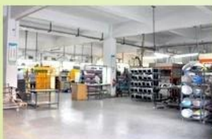
1. Helmet house

established in the year of 2012, more than 22 years experience. Expert in production of all kinds of helmets for different sports. Excellent quality, reasonable price, fast delivery makes us get very good reputation among our customers. Expert in OEM and ODM orders. Our skilled R&D team offers one stop service for throughout customers. 99% export and our main market is North America, European, Australia, Japan etc. Your enquiry is very welcomed and we will try our utmost to help you establish solid market. We are looking for long term relationship and get win win situation.