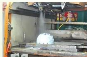
3. PC blister tooling