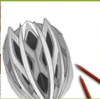
2. Conception Ideation