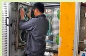
4. In-Mold producing process