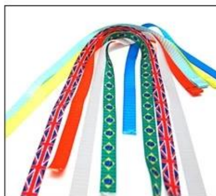
Available colored/patterned strap