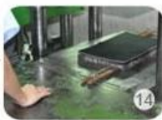
Inner padding production