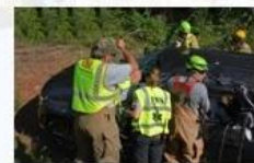
Rescue and evacuation