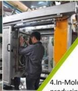
4. In-Mold producing process