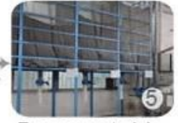
Eps raw material by different density