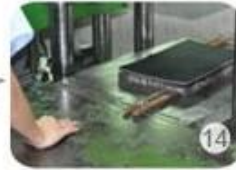
Inner padding production