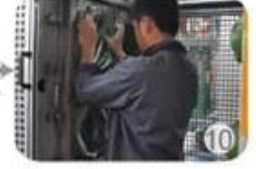
In-mold producing process