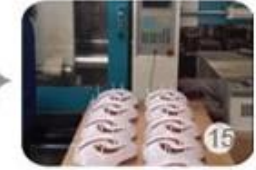
Plastic injection workshop