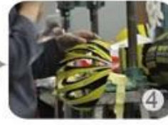
Trimming dug hole