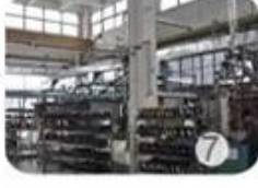
Helmet in-mold workshop