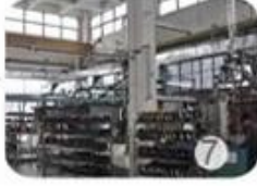
Helmet in-mold workshop