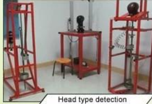
Head type detection