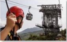
Cable car maintenance