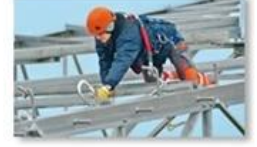
Work at height