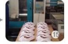
Plastic injection workshop