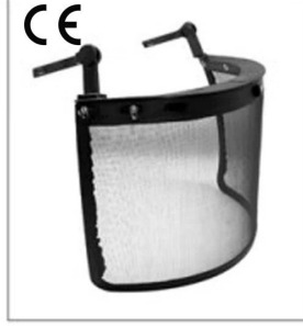
Iron mesh faceshield EN 1731

3) Plastik vizörlü emniyet kaskı Set bizimkiyle uyumludur özel vizör ve kulaklıklar : Vizör Plastik gözlü Koruma, Kulaklıklar .