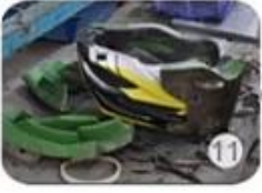
semi-finished In-mold helmet