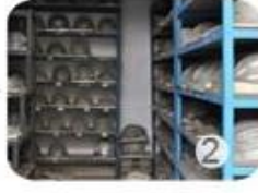
PC blister tooling