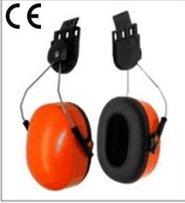
Noiseproof earmuff EN 352-3:2002