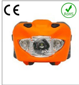
Versatile LED headlight 3A EN 61547:2009