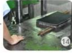
Inner padding production