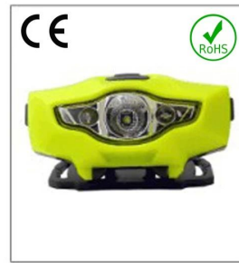
Versatile LED headlight 1A EN 55015: 2006