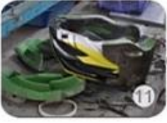
semi-finished In-mold helmet