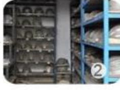
PC blister tooling