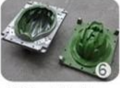
EPS in-mold tooling