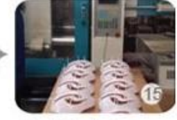
Plastic injection workshop