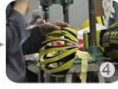
Trimming dug hole