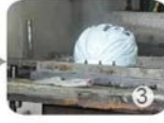
PC blister manufacture