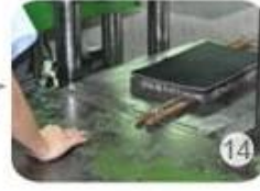
Inner padding production