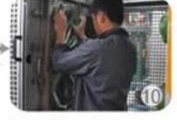
In-mold producing process