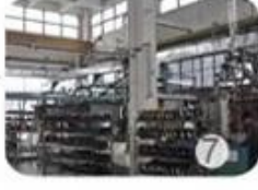
Helmet in-mold workshop