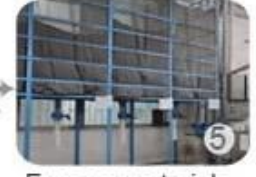
Eps raw material by different density