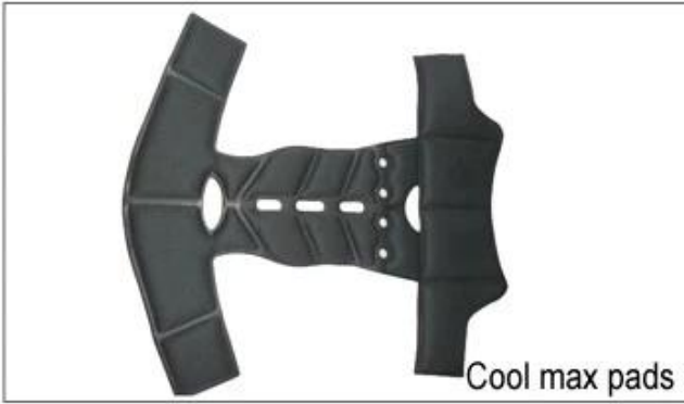
Cool max pads