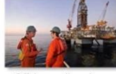
Offshore oil and gas