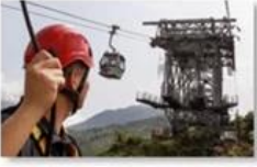
Cable car maintenance