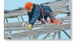
Work at height