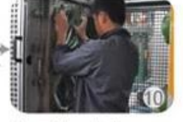
In-mold producing process