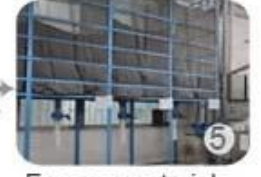
Eps raw material by different density