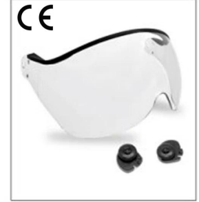
New deve loped clear visor EN266