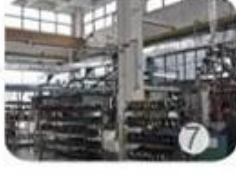
Helmet in-mold workshop