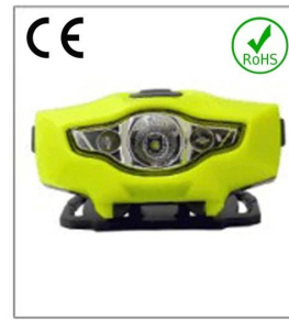
Versatile LED headlight 1A EN 55015: 2006