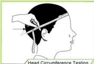
Head Circumference Testing