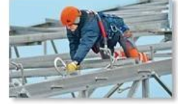
Work at height