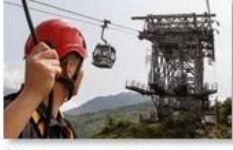
Cable car maintenance