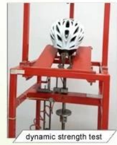
dynamic strength test