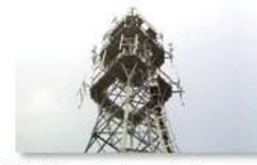
Mobile plant maintenance