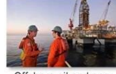
Offshore oil and gas