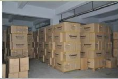
9. finished helmet