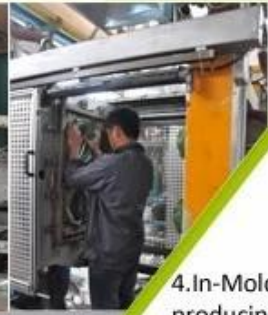
4. In-Mold producing process