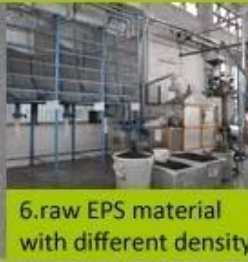
6. raw EPS material with different density