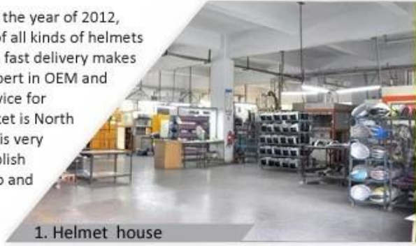
1. Helmet house

Shenzhen Aurora Sports Goods Co., LTD established in the year of 2012, more than 22 years experience. Expert in production of all kinds of helmets for different sports. Excellent quality, reasonable price, fast delivery makes us get very good reputation among our customers. Expert in OEM and ODM orders. Our skilled R&D team offers one stop service for throughout customers. 99% export and our main market is North America, European, Australia, Japan etc. Your enquiry is very welcomed and we will try our utmost to help you establish solid market. We are looking for long term relationship and get win win situation.