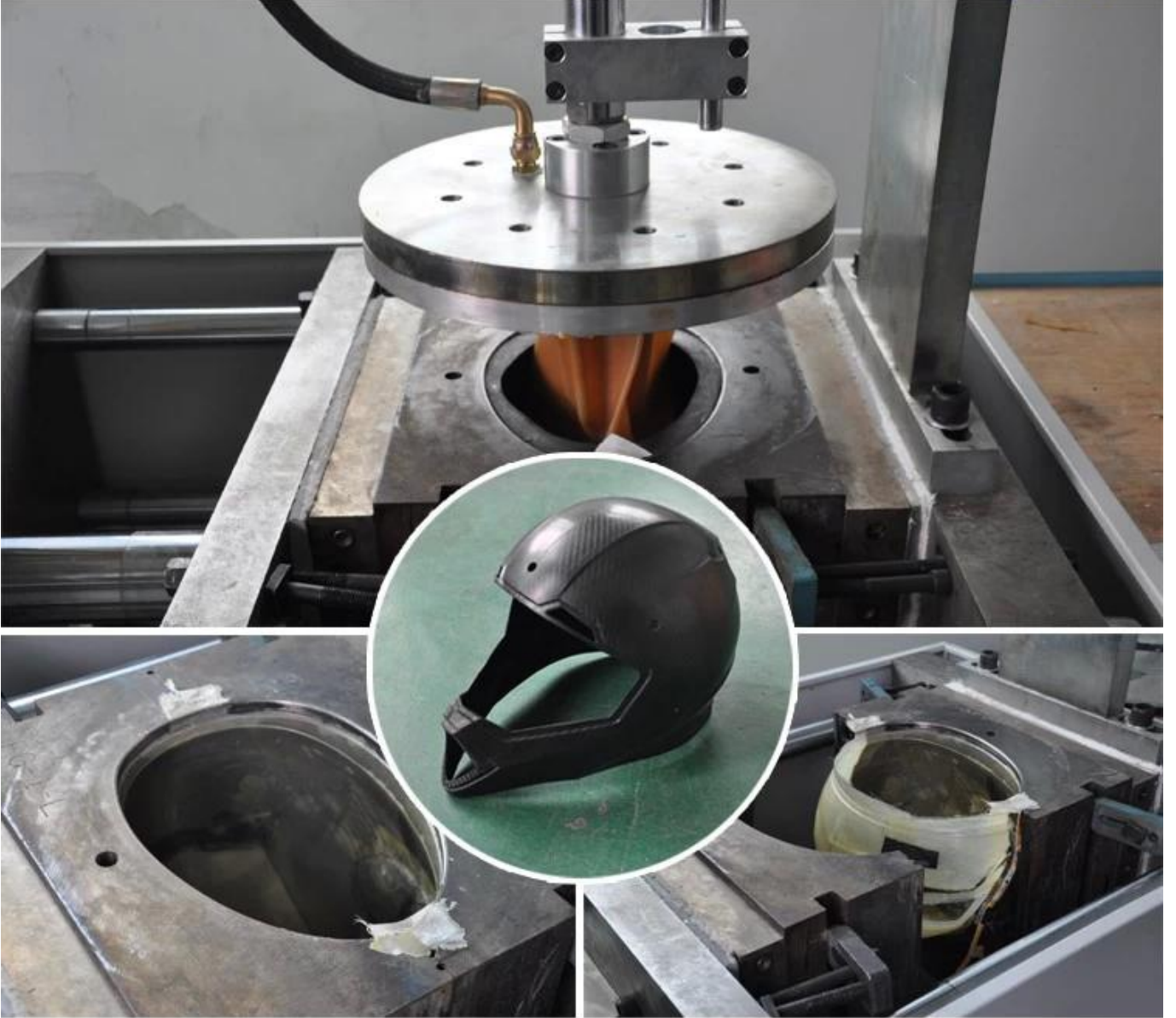
2. Otoklav işleme (Vakum Torbalı)