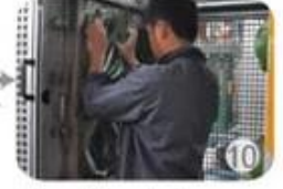
In-mold producing process