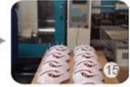
Plastic injection workshop