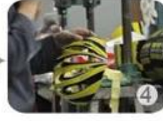
Trimming dug hole