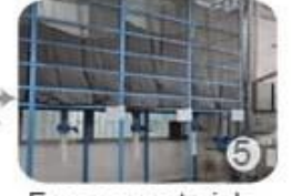
Eps raw material by different density