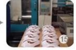
Plastic injection workshop