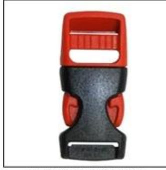
ITW standard helmet buckle