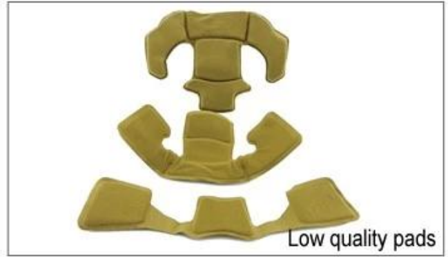
Low quality pads