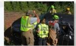
Rescue and evacuation