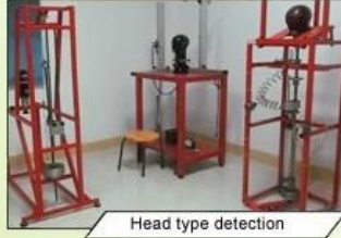
Head type detection