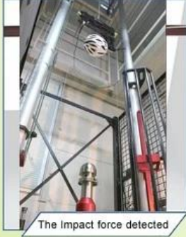
The Impact force detected