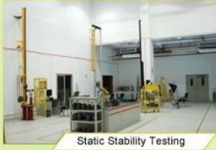
Static Stability Testing

Every manufacturing steps at AURORA follows adhere to strict quality parameters and focus on quality throughout the each stagesinvolved. All raw material and semi finished goods at AURORA pass strict quality control. The finished product, helmets at Aurora is then tested and qualified to export to the world.